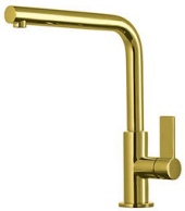
Mischbatterie Omega Gold